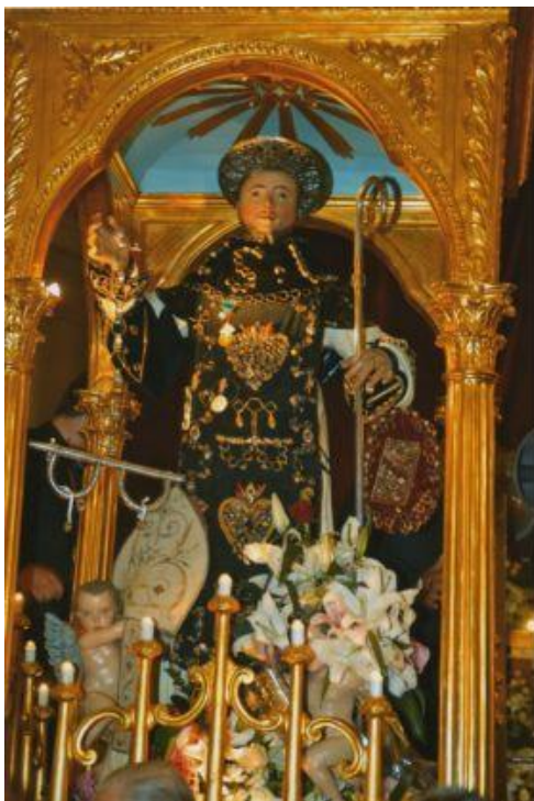
Il simulacro del Santo

La facciata principale della chiesa presenta una suddivisione in tre parti così come le corrispondenti navate interne arricchite con interessanti altari in marmo, mentre l'altare maggiore è in stile basilicale. Nella navata centrale domina imponente un lampadario dal peso di 650 chilogrammi, illuminato da ben 200 lampadine.