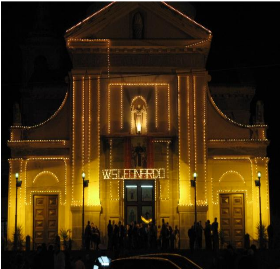
La chiesa illuminata durante i festeggiamenti

San Leonardo abate del Limosino (castello di Vandôme, Corroi, circa 496 – Noblac, 6 novembre 545 o forse 559), è stato un abate francese, che visse da eremita gran parte della vita; è considerato Santo dalla Chiesa cattolica, in particolare nel Medioevo fu uno dei Santi più venerati in Europa.