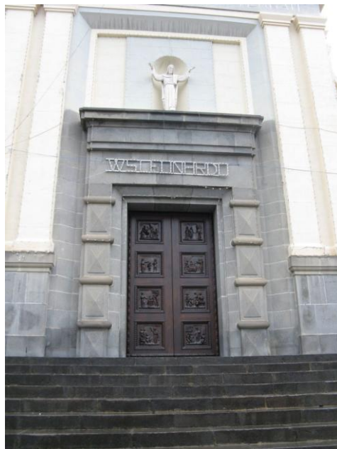
Il portone scolpito con la vita del Santo

Le altre parti che compongono la chiesa sono: il transetto, la cupola con la lanterna, il campanile; esse risultano armonicamente inserite nel complesso edificio, dove si evidenzia anche l'utilizzo della pietra lavica quale rivestimento del sistema del portone centrale di ingresso, in legno massiccio scolpito con i momenti salienti della vita di San Leonardo di Noblac.